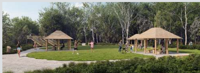
Miejsce rekreacji z altanami grillowymi