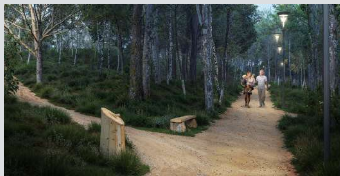
Alejki spacerowe i mała architektura