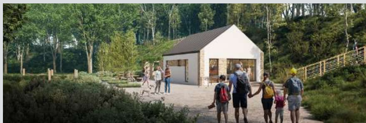
Budynek poświęcony historii piaskowca