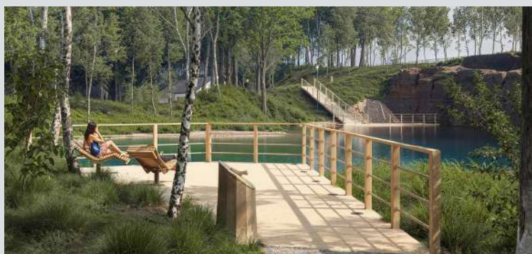
Widok od strony pomostu

również miejsca, które będzie poświęcona historii szydłowieckiego piaskowca. To kolejna inwestycja, która rozbuduje nie tylko ofertę rekreacyjną dla mieszkańców Szydłowca i okolicznych miejscowości, ale przyczyni się do turystycznego rozwoju naszego miasta.